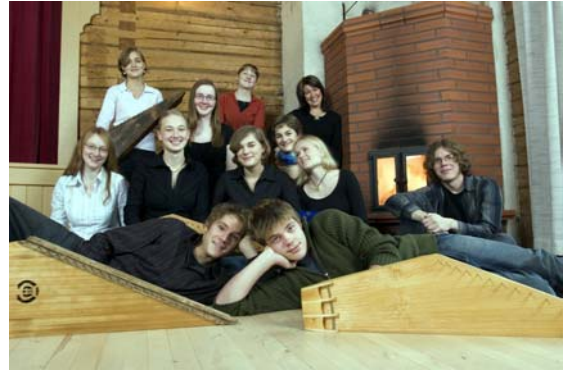
Brelo syksyllä 2005

Lisäksi laukkoskelaiset Essi ja Valtteri olivat mukana 5-jäsenisessä Alhidan-yhtyeessä, joka voitti kilpailuissa 16-18-vuotiaiden pienyhtyesarjan.