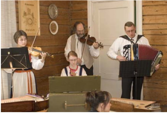
Pelimannit tahdittivat usean ryhmän tanssit.