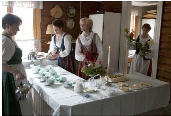
Kakku ja kahvi maistuivat.