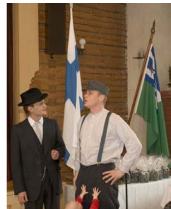
F.E. Sillanpää: Juhannusvieraat