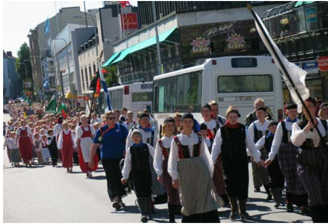
Islantilaisten pieni ryhmä sai aina ilmestyessään innokkaat aplodit.