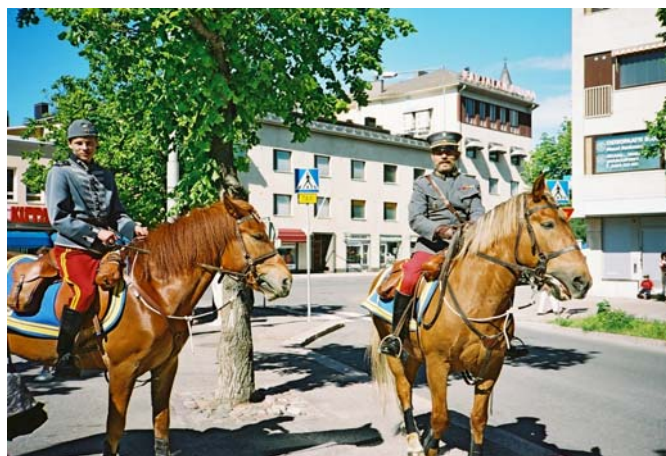
Kulkueen johto oli hyvissä käsissä - vai pitäisikö sanoa: kavioissa.