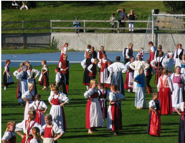
Laukkosken ryhmää kuvan keskivaiheilla.