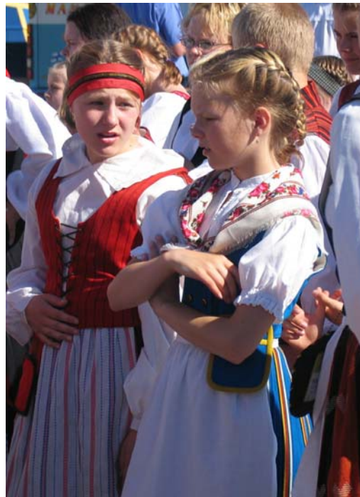
... juhlakulkueen lähtöä.