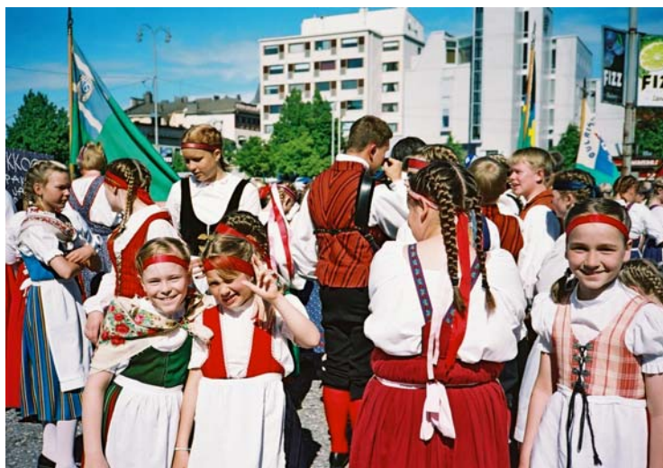
Laukkosken tyttöjä ...