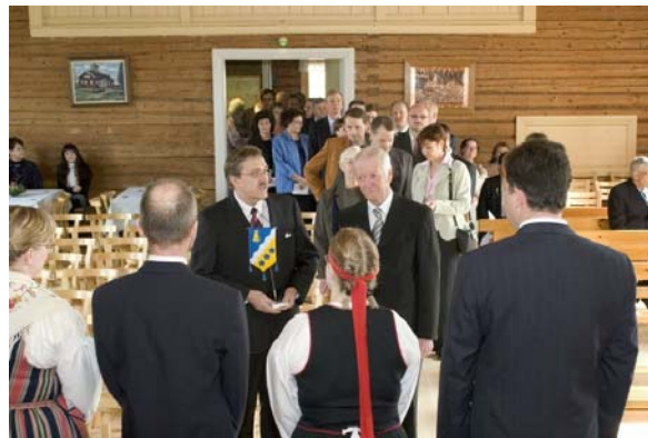
Onnittelijoita riitti jonoksi asti.