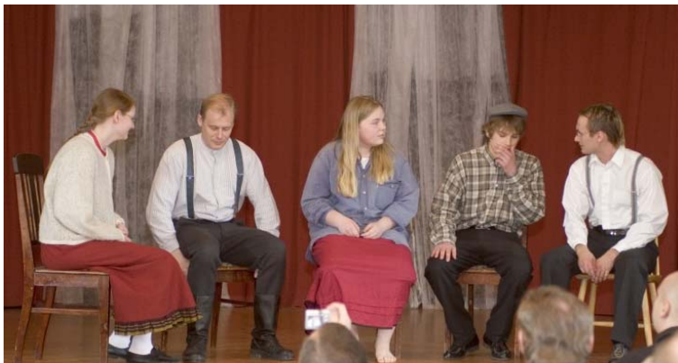
Keskusteluilta seuran alkuvuosilta.