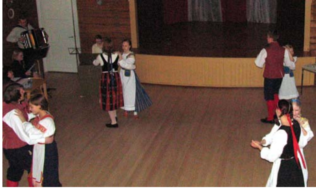
Juhlailtamissa esiintyi nuorten tanssiryhmä.