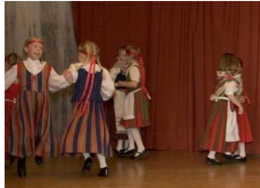
Aikamatkan esiintyjien nuorimmat.