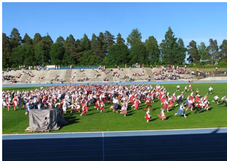
"Sika karkaa!" Suomalaisten esitys oli yhteisesityksistä suurin, tässä oman osuuden lopetus.