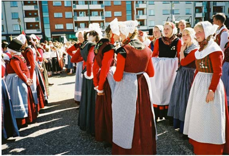
Väriä ei torilta puuttunut, kun odoteltiin ...