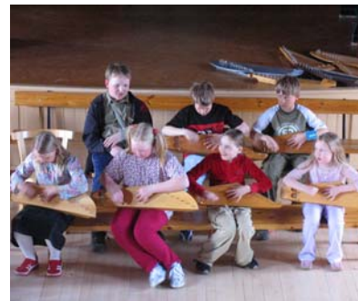
Kaikki neljä ryhmää esiintyivät, tässä niistä kaksi.