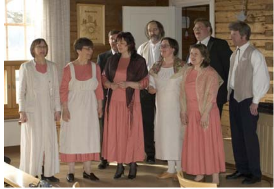
Lauluja sadan vuoden takaa.