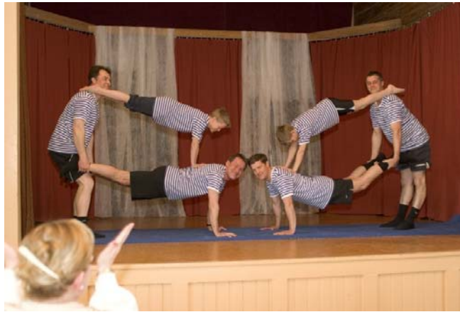
Kuin suoraan vanhoista valokuvista!