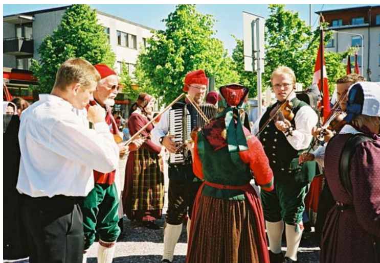
Hiippalakit ovat käytännöllisiä säässä kuin säässä.