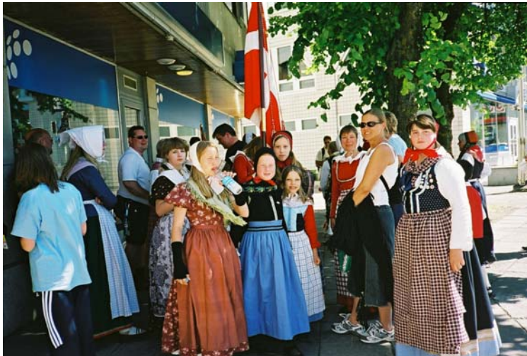
Tanskalaiset viihtyivät varjossa helteisenä päätöspäivänä.