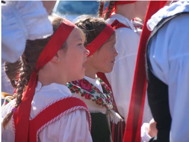
... Lappeenrannan torilla.