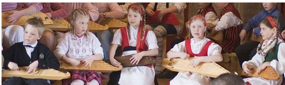
Kanteleensoittajat aloittivat juhlan.