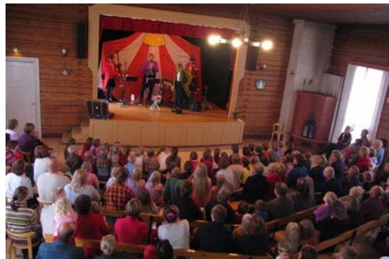
Klovni Dodo yhteineen lumosi isot ja pienet.